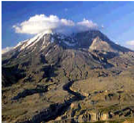
Mont St. Helens

Le Mont St. Helens a fait éruption vers l'an 1980. Son sommeil à durée plus de 100 ans avant l'éruption. Quelques semaines après l'éruption, les chercheurs ont découvert une sorte de roche. C'était la roche ignée .