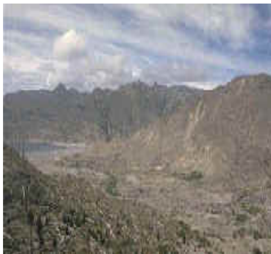
Photos du Mont St. Helens